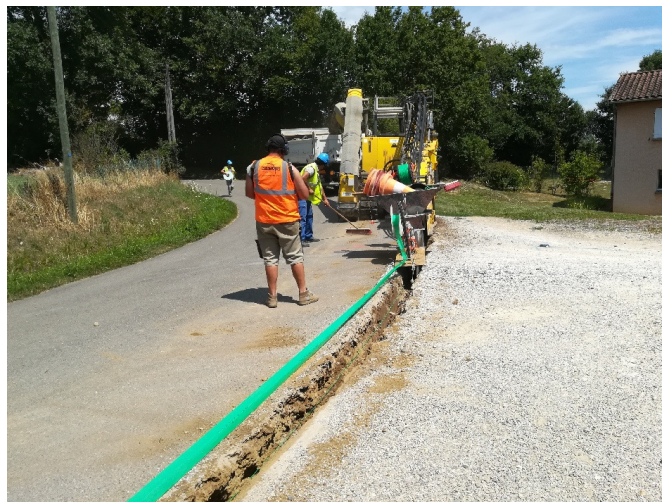
Enfouissement des gaines en bordure de voirie