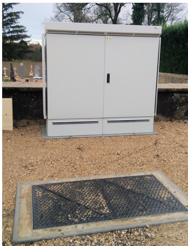
Armoire de raccordement (NRO)

Les travaux sont actuellement à une étape avancée, il reste encore principalement le câblage du NRO ainsi que la fin du déploiement dans les hameaux.