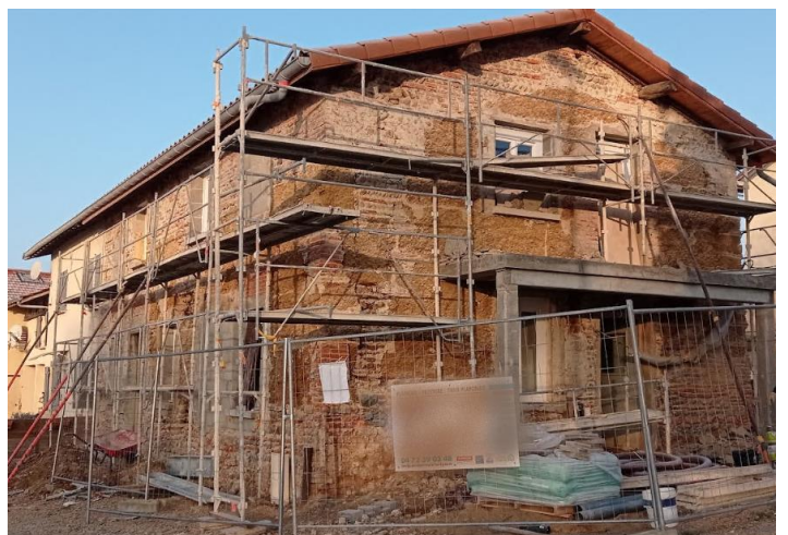
Etat d'avancement des façades du nouveau bâtiment communal

Vous pouvez les contacter par mail à : parents.rpi.blp@gmail.com